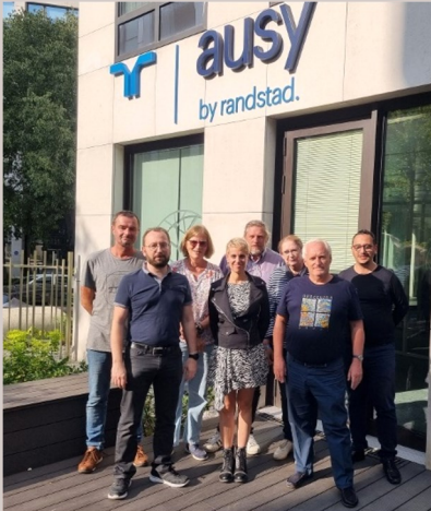
L'équipe actuelle CFDT au CSE

Une équipe qui s'agrandit sans cesse afin de vous répondre et s'inscrire dans des valeurs de démocratie. En deux ans, pas moins de neuf élus ont fait le choix de rallier