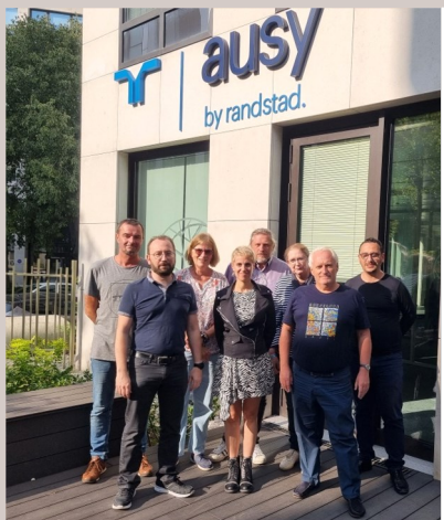
L'équipe actuelle CFDT au CSE

Une équipe qui s'agrandit sans cesse afin de vous répondre et s'inscrire dans des valeurs de démocratie. En deux ans, pas moins de neuf élus ont fait le choix de rallier nos troupes ! Nous sommes les représentants les mieux répartis sur l'ensemble de la France, un service aux salariés au plus près du terrain.